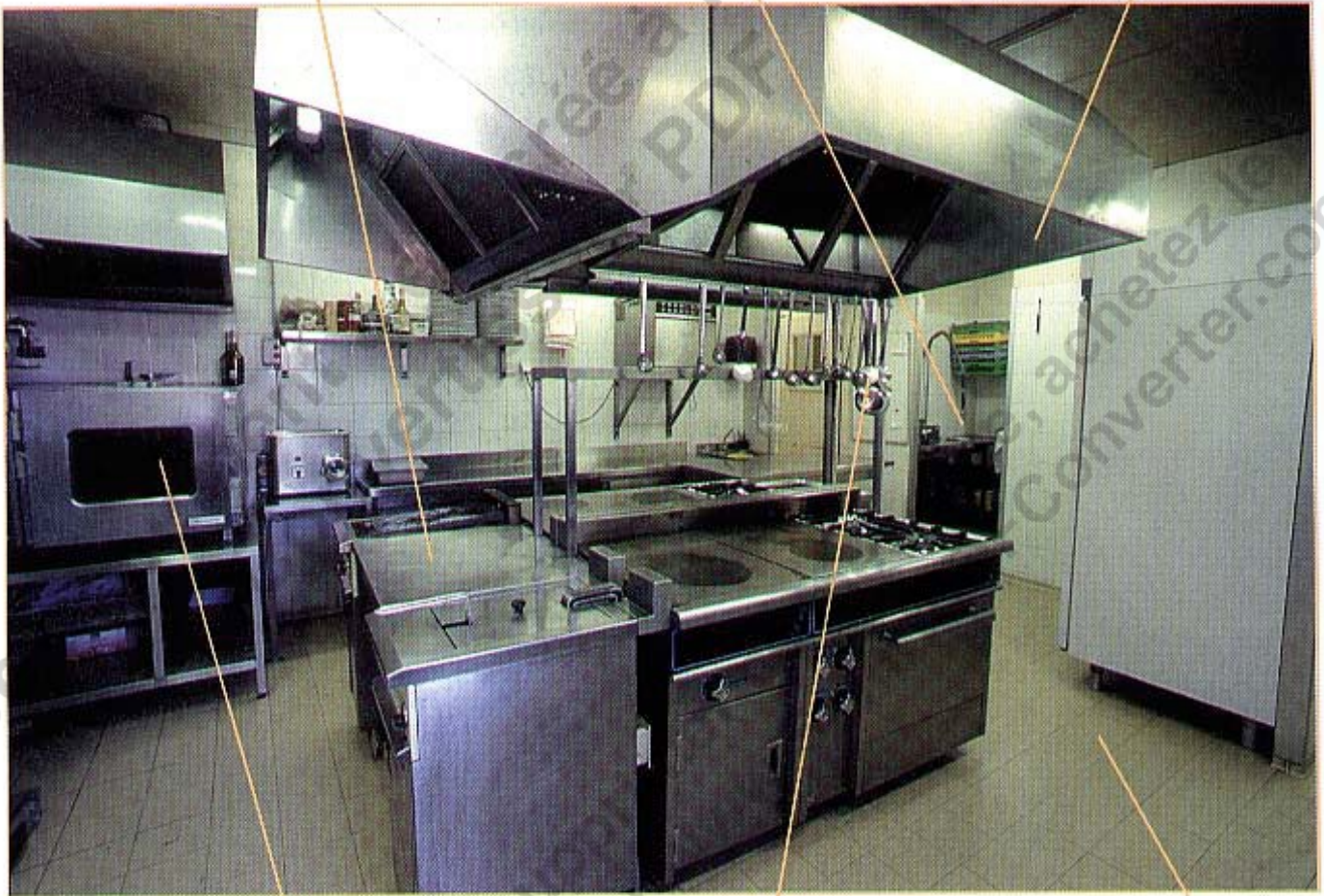
FARAL OPTIMUM 402