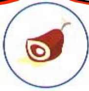
IDOS DN et IDOS 3000 IDOS DS PAE