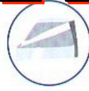
FARAL OPTIMUM 403 FARAL OPTIMUM 501