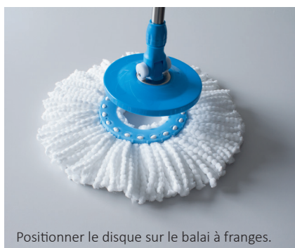
Positionner le disque sur le balai à franges.