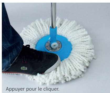
Appuyer pour le cliquer.